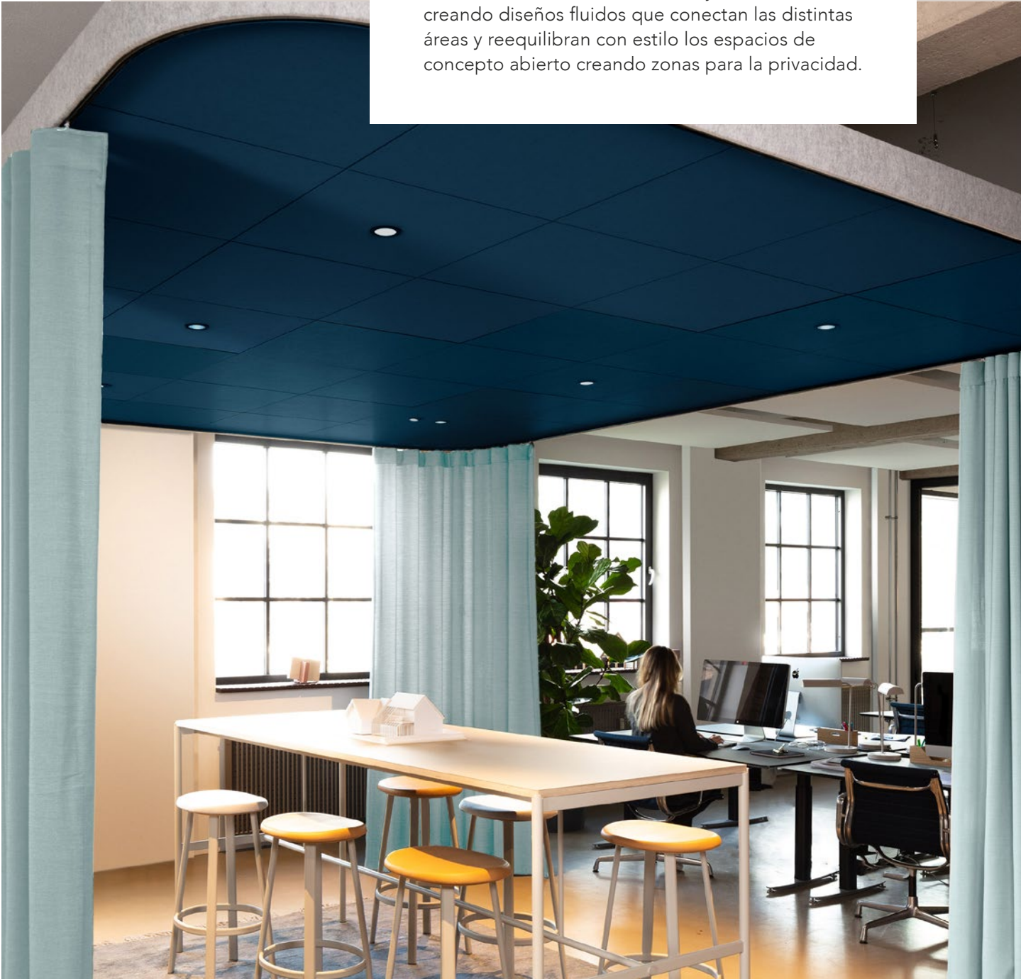
Hub Pequeño Espacio de descanso, espacio creativo, área de trabajo para dos personas Dimensiones 3000 x 4800mm Marco Feltro gris oscuro Panel Rockfon Color-all®, Eucalyptus

Innove con áreas acústicamente optimizadas que incorporen un bonito elemento de diseño y una función práctica a sus interiores. Rockfon Hub está disponible en una selección de colores de diseño como el verde biofílico, el azul intenso, el gris frío o el blanco, y se complementa a la perfección con cualquier solución acústica existente. Además, se puede añadir una cubierta de fieltro al marco, así como iluminación y las cortinas que se desee (desde telas translúcidas hasta tejidos acústicos), creando diseños fluidos que conectan las distintas áreas y reequilibran con estilo los espacios de concepto abierto creando zonas para la privacidad.